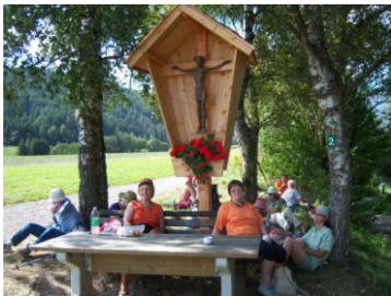
Erster Pausenplatz auf dem Weg nach Inzing

Interessenten für die Herbstetappe 2010 melden sich bitte bei Lisa Kutmon 0699-16202020.